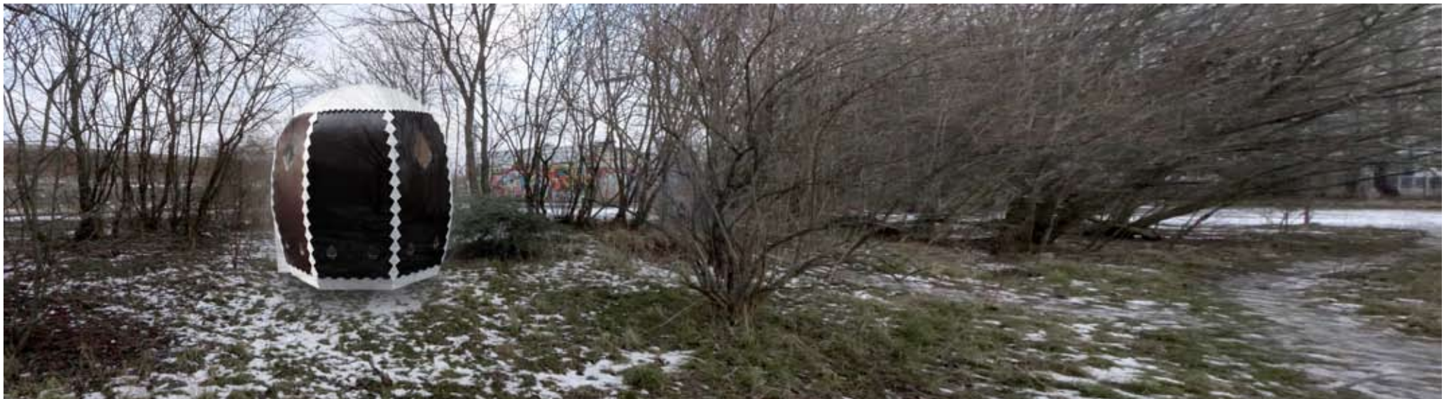
Placering nummer 2