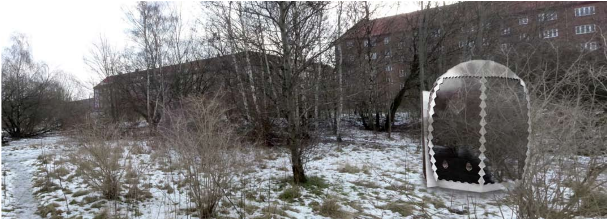
Placering nummer 3