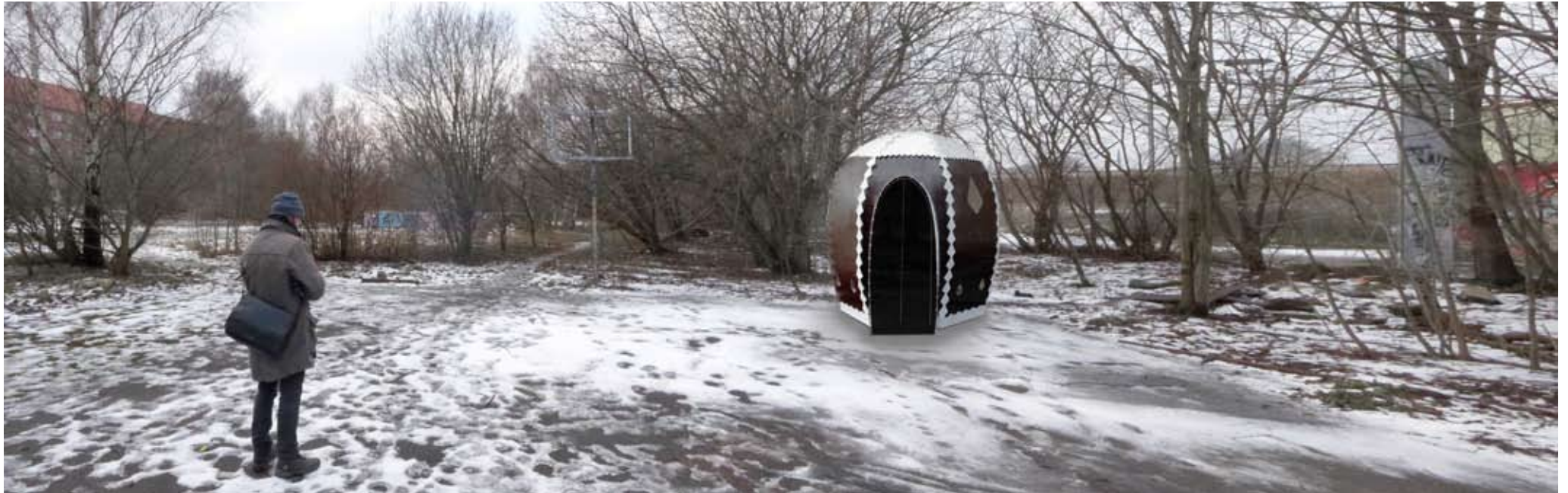
Placering nummer 1